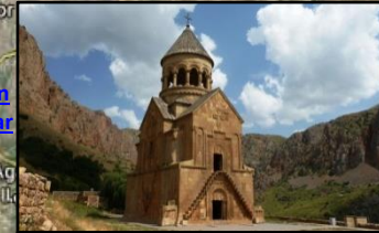
Noravank Monastery Նորավանգ