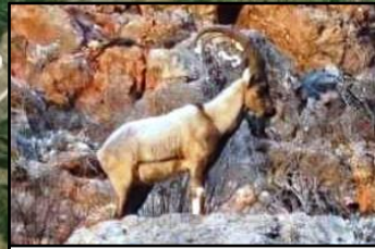
Yeghegis Sanctuary, Shatin Եղեգիսի արգելավայր, Շատին