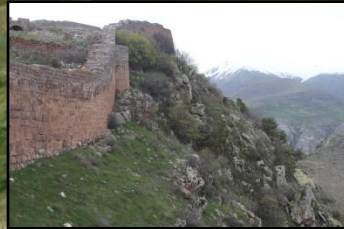
Smbataberd Fortress Սմբատաբերդ