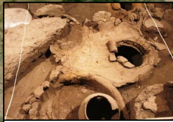
Areni-1, World's Oldest Winery Արենի-1 աշխարհի հնագույն գինեգործարանը