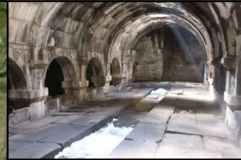
Orbelian's Caravanserai, Silk Rd. Օրբելյանների իջևանատունը