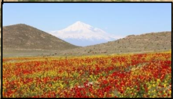
Ararat and Wild Flowers Արարատը և վայրի ծաղիկները