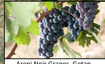
Areni Noir Grapes, Getap Խաղող «Արենի նուար», Գետափ