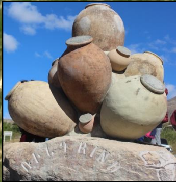
Karas Monument, Silk Road Wine Trail start, Chiva «Կարաս» մոնումենտ, «Գինու արահետը Մետաքսի ճանապարհին» սկիզբը, Չիվա

Գինու արահետը Մետաքսի ճանապարհին Vayots Dzor, Armenia Վայոց Ձոր, Հայաստան