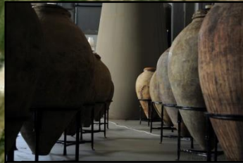
Karas Wine Vessels, Rind Գինու կարասներ, Ռինդ